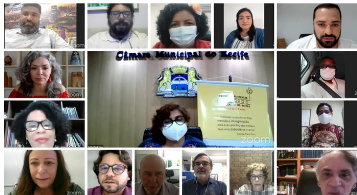
Frente pelo Centro do Recife realizou a primeira reunião pública