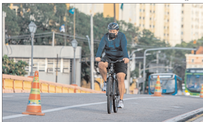
Estudo tem o objetivo de mapear as mudanças na mobilidade do Recife durante a pandemia

FISCALIZAÇÃO - Agentes de trânsito têm recebido formação continuada sobre abordagens efetivas na fiscalização. As orientações têm sido cada vez mais detalhadas para que os profissionais se comuniquem com os cidadãos com o