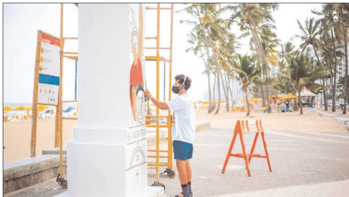
Tradicionais postos salva-vidas localizados na Praia de Boa Viagem vão ganhar novas cores inspiradas nos ritmos pernambucanos

O Salva-Arte é um projeto que nasceu em 2015 levando cores e arte urbana às delgadas estruturas de concreto em estilo Art Déco.