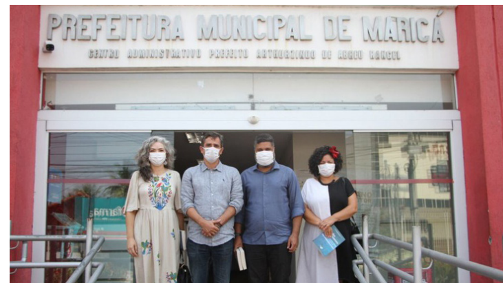
Frente pela Renda Básica visitou a cidade de Maricá