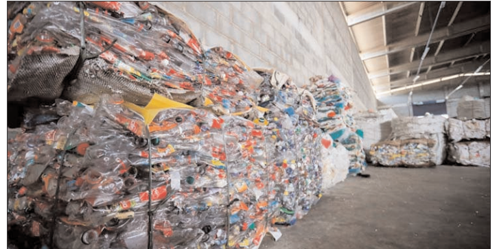
O reconhecimento dado pela PCR fortalece a atuação da cooperativa e a inclusão social das mulheres

O reconhecimento dado pela PCR vai fortalecer a atuação, no desenvolvimento da política pública de gestão dos resíduos sólidos - conforme recomenda a Lei Federal nº