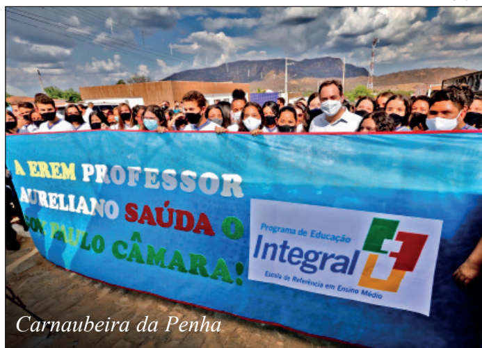
Carnaubeira da Penha

Em Carnaubeira da Penha, o governador Paulo Câmara autorizou a licitação das obras da PE-425 – um dos principais acessos viários