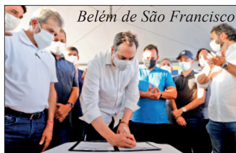
Belém de São Francisco