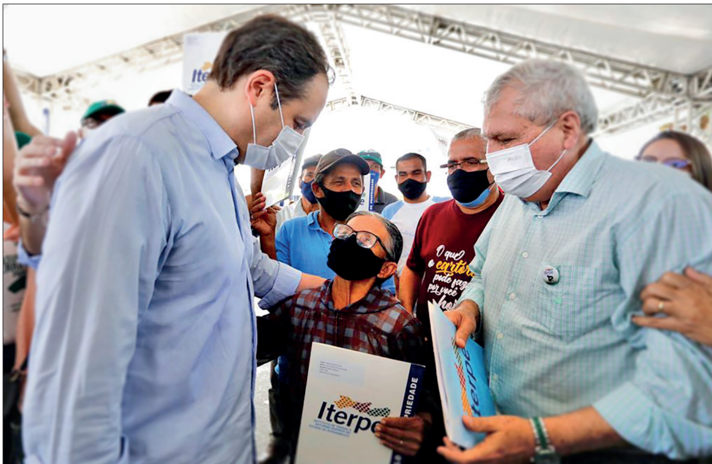
EM BOM CONSELHO , Paulo Câmara entregou 207 títulos de acesso à terra para agricultores e agricultoras e em Brejão liberou recursos e anunciou novas ações do Plano Retomada

Na área de educação, o Governador autorizou a contratação da empresa que fará a reforma e ampliação da Escola Municipal São Geraldo. A unidade faz parte do Programa Educação Integrada e receberá um investimento de mais de R$ 660 mil. Ele autorizou ainda a licitação para contratação da empresa responsável pela construção da quadra coberta na Escola Estadual Mestra Beatriz, e a implantação de um Polo de Educação à Distância da Universidade de Pernambuco (UPE), que ofertará cursos de Biologia, História, Pedagogia, Letras e Administração.