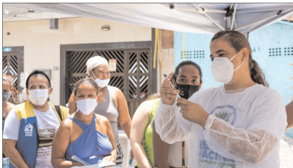
Desde o início da ação, os profissionais da Secretaria Municipal de Saúde aplicam quase 17 mil doses dos imunizantes em 107 localidades

Confira a programação no www.recife.pe.gov.br .