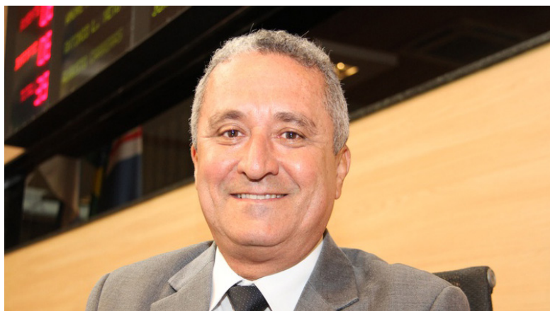
Segundo o diretor do Departamento Legislativo, os vereadores apresentaram 944 propostas

A proposta orçamentária para o município no Recife para 2022 (Lei Orçamentária Anual, LOA) e as diretrizes, objetivos e metas da administração pública municipal para as despesas no próximo ano (o Plano Plurianual, PPA) receberam uma quantidade recorde de emendas dos vereadores. Ao final do prazo para recebimento das propostas, na quarta-feira (27), o Departa-