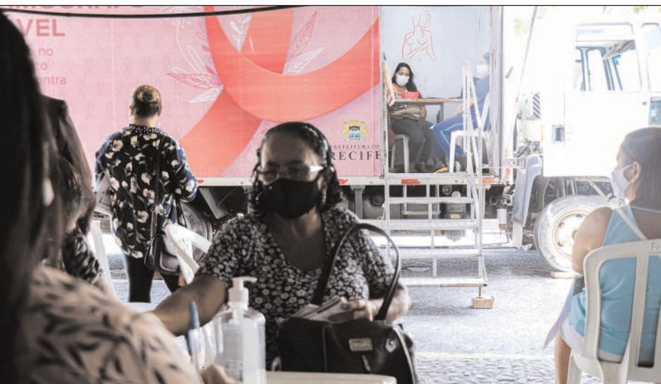
A unidade vai circular por 28 localidades da capital. Serão oferecidas 1.920 vagas para exames de mama em mulheres moradoras da cidade com idades entre 50 e 69 anos

A mamografia é o único exame cuja aplicação em programas de rastreamento apresenta eficácia comprovada na redução da mortalidade por câncer de mama. De janeiro a setembro deste ano,