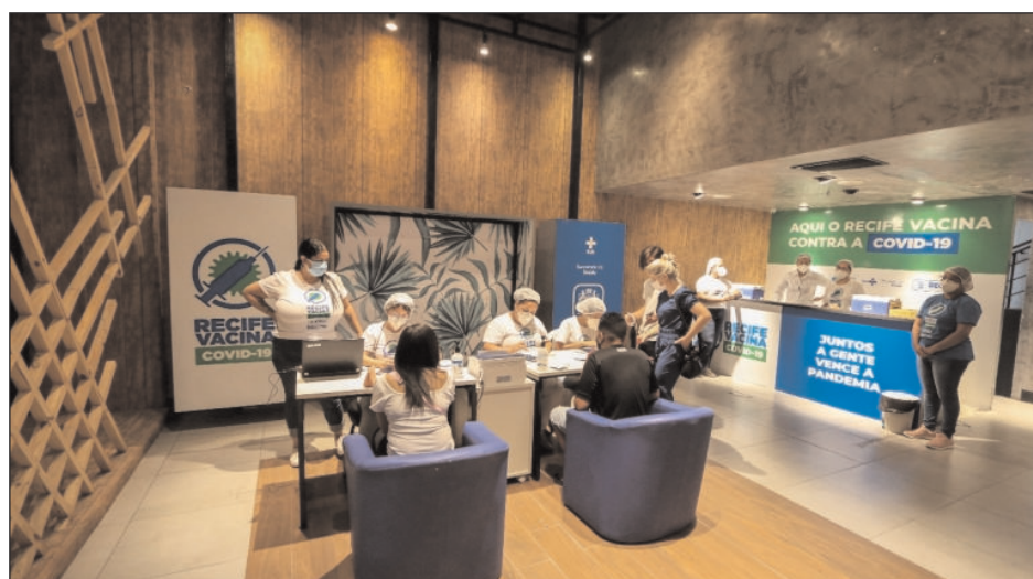
Iniciativa, sem necessidade de agendamento, ocorre no Tacaruna (Santo Amaro), Boa Vista, Recife (Boa Viagem) e RioMar (Pina)

térreo), no bairro de mesmo nome, e no Recife (no piso superior, próximo ao cinema), em Boa Viagem.