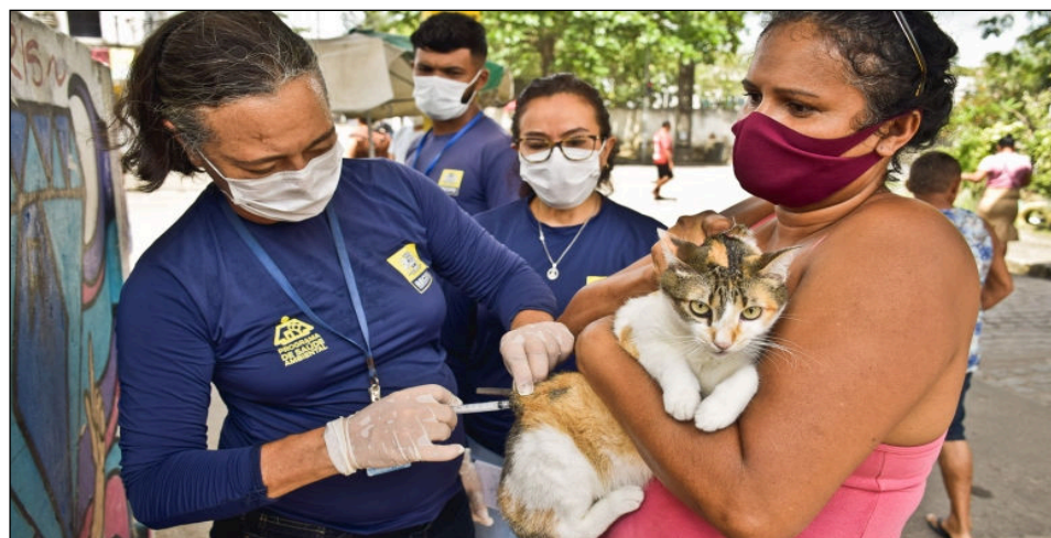
Expectativa é que 100 mil cães e gatos sejam imunizados nos 154 postos e três drive-thrus disponibilizados em toda a cidade

Jardim, em Boa Viagem. A lista completa dos locais onde haverá atendimento está disponível no site www.recife.pe.gov.br .