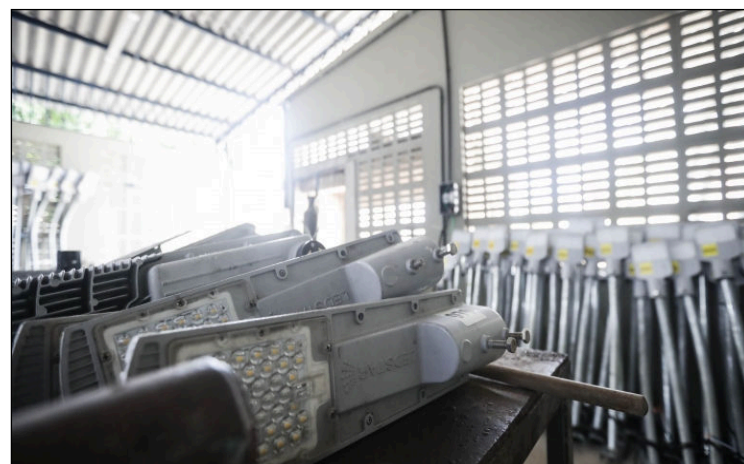
Até o dia 1º de dezembro foram instaladas 96.084 luminárias; até o final do ano, 100% das luminárias do Recife serão do tipo LED

Para o atendimento da meta de substituição de todas as luminárias para LED nesses logradouros, restam 2.177 pontos de iluminação, que estão distribuídos em 574 escadarias. Até o momento o programa Ilumina Recife já é responsável pela redução de 36 GWh/ano de consumo de energia o que corresponde a uma economicidade de R$ 16,5 milhões de reais por ano com os custos