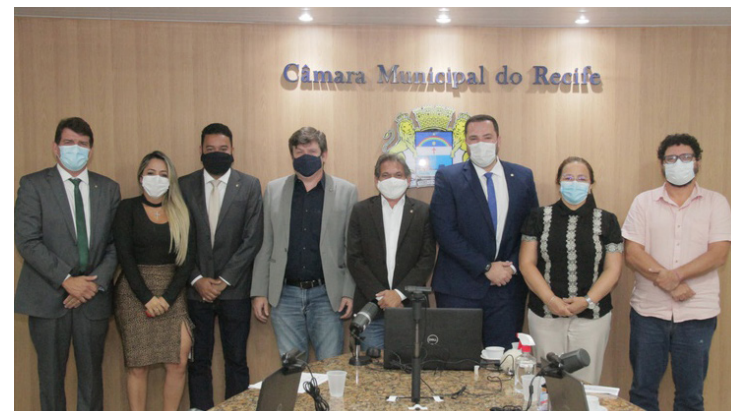
Câmara instala Comissão para discutir retomada do carnaval e grandes eventos