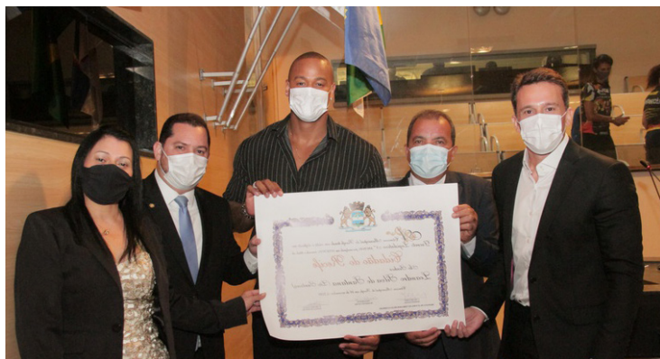
Léo Santana é o mais novo Cidadão do Recife

Com sete álbuns lançados, Léo Santana, de 33 anos, é natural de Salvador, na Bahia, do bairro do Lobato, área periférica da cidade. De 2009 a 2020 ele já foi indicado a 14 prêmios, recebendo sete deles. Em 2009, o cantor estourou no mundo todo com a música “Rebolation” como hit do verão, ainda na antiga banda Parangolé, que o levou ao Guinness Book com a canção mais tocada no mundo em 2010. Ex-morador do Recife, cidade que o acolheu como um exemplo de nordestino que conseguiu conquistar o mundo, Léo Santana, o gigante, se tornou,