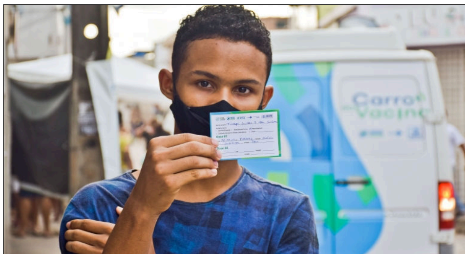
Apenas na quarta-feira (8), feriado de Nossa Senhora da Conceição, não vai haver ação

A Prefeitura do Recife vai levar a vacinação contra covid-19 para 16 comunidades da capital nesta semana. Tendo início ontem (6) e seguindo até a próxima sexta-feira (10), das 8h às 12h, os profissionais da Secretaria Municipal de Saúde realizarão busca ativa dos moradores que estão dentro do perfil para receber a primeira dose da vacina ou ainda aqueles que estão no prazo para segunda dose, em atraso ou que já podem receber a dose de reforço. Apenas na quarta-feira (8), feriado de Nossa Senhora da Conceição, não vai haver ação. A ação da Prefeitura do Recife começou em agosto e já aplicou 38 mil doses dos imunizantes em 121 localidades.