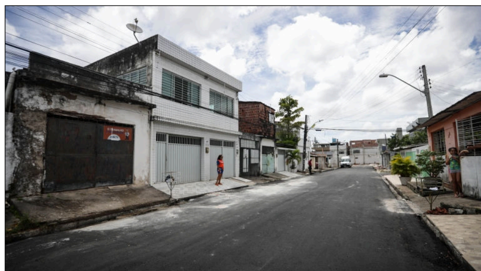
Obra faz parte de um conjunto de intervenções promovidas na infraestrutura da cidade

AÇÃO VERÃO 2021 - A Prefeitura do Recife anunciou no início do mês de setembro um pacote de serviços e melhorias, com investimentos de mais de R$100 milhões, para reforçar o trabalho de manutenção e recuperação da infraestrutura da cidade após o período de maiores chuvas na cidade. São mais