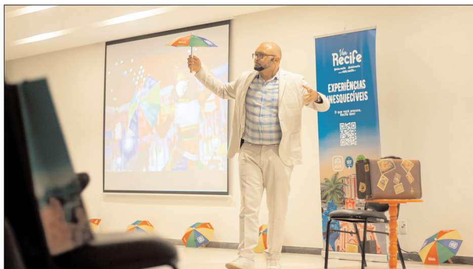
A gestão municipal concorre com o Roadshow Viva Recife na categoria Inovação e Sustentabilidade

RECONHECIMENTO - Esta não é a primeira vez que Recife é premiada por sua criatividade. Em 2019, a Prefeitura do Recife ganhou dois troféus no Prêmio Pernambuco de Turismo. A capital foi a grande vencedora na categoria Inovação e Sustentabilidade com o Plano de Turismo Criativo do Recife, e 2ª colocada com o Festival Recife Urbana Arte (R.U.A.). Outro reconhecimento para a cidade veio com o Prêmio Nacional do Turismo 2019, realizado pelo Ministério do Turismo. A cidade foi vencedora com o Festival O Boi Voador, na categoria Melhor Iniciativa de Aproveitamento do Patrimônio Cultural para o Turismo - Iniciativas de Destaque. A peça remonta à passagem histórica do Brasil Holandês, quando Nassau fez um boi voar.