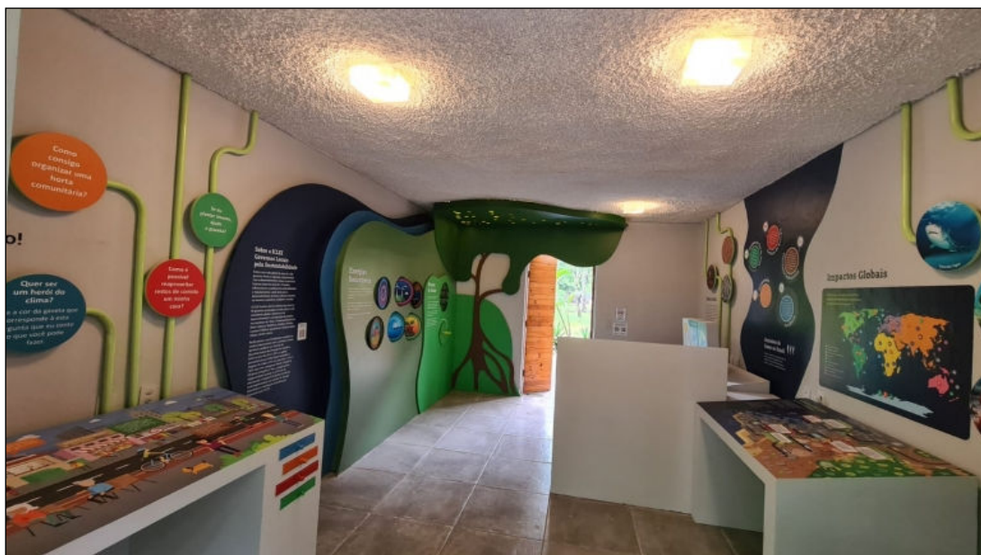
Espaço fica no Econúcleo do Parque da Jaqueira e é uma parceria com ICLEI América do Sul