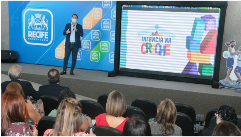
Romerinho Jatobá participou do lançamento do edital de creches na Prefeitura de Recife.

O presidente da Câmara Municipal do Recife, Romerinho Jatobá (PSB), representou o Poder Legislativo em cerimônia realizada na prefeitura na terça-feira (7), quando foi anunciado edital para a instalação de creches na cidade. O anúncio contou com as presenças do secretário municipal de Educação, Fred Amâncio, da vice-prefeita Isabella de Roldão e do prefeito João Campos, além de servidores, profes-