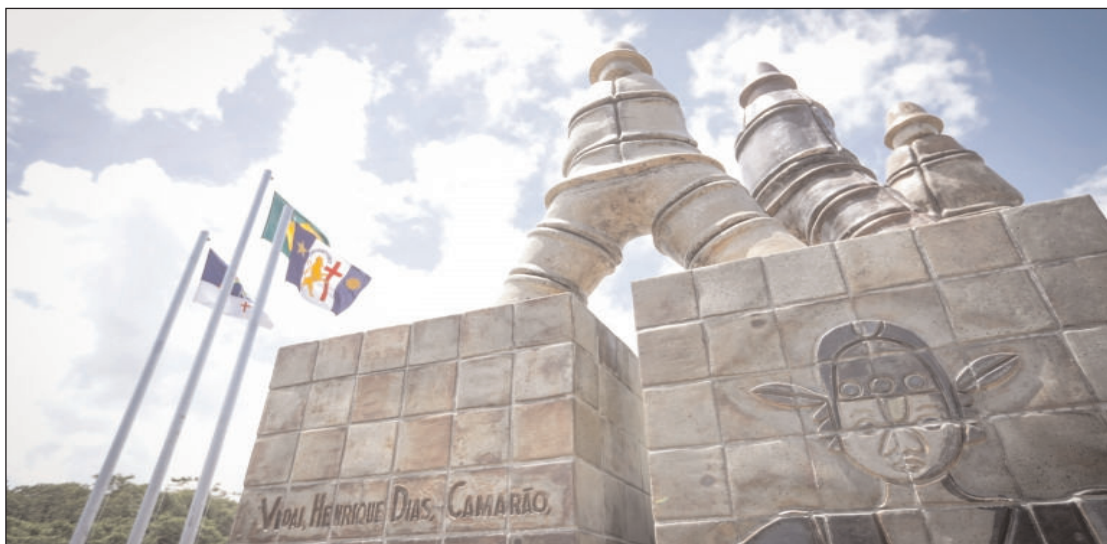
Entrega do monumento aconteceu ontem (17). A Batalha dos Guararapes foi uma luta armada em que brancos, negros e índios lutaram contra o exército invasor holandês pelo domínio da região Nordeste do Brasil

Coube à Prefeitura do Recife, por meio da Autarquia de Manutenção e Limpeza Urbana do Recife (Emlurb), instalar a base para o monumento no novo local, com investimento de R$ 73.135,37. Foi feita uma base em concreto armado com fechamento em alvenaria de bloco de concreto para receber as esculturas. Além disso, a Emlurb instalou quatro refletores de LED para iluminar as obras, investindo R$ 5.500.