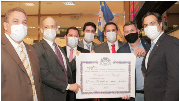
Presidente do TCE-PE recebeu Título de Cidadão do Recife

A Câmara Municipal do Recife promoveu solenidades e reuniões marcantes esta semana. Parte dos eventos foi realizada de forma presencial e outra, de forma virtual. Todas as pessoas podem acompanhar os eventos, ao vivo, tanto pelo site institucional, quantos pelas redes sociais da Casa.