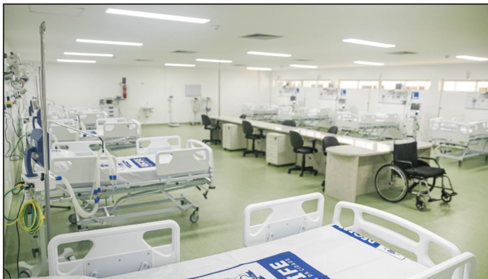
Capital pernambucana concentra esforços para combater aumento de casos de síndrome respiratória aguda grave (srag) em decorrência de surto de gripe

casos diários confirmados para Influenza A H3N2 saltou de 8 para 138 casos entre os dias 13 e 29 de dezembro, com picos de até 314 casos em um só dia (27 de dezembro), levando a Prefeitura a concentrar todos os esforços em ampliar o acesso a serviços e assistência à população. Dentre as medidas, estão o reforço das equipes com mais 162 profissionais para a rede básica e o sistema do Atende em Casa, as estratégias de ampliação de pontos de vacinação, a abertura de 40 leitos para pacientes de srag no Hospital Eduardo Campos da Pessoa Idosa (HECPI) e a ampliação dos pontos de testagem para Influenza, incluindo dois pontos fixos, um no Parque Urbano na Macaxeira e outro no Compaz Ariano Suassuna, no Cordeiro.