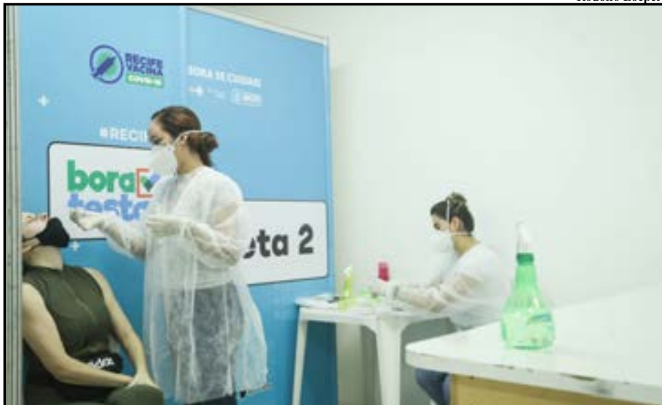
O acesso aos testes é feito mediante agendamento via aplicativo ou site do Conecta Recife. As vagas são abertas todos os dias às 15h

centro e também dos centros do Compaz Governador Eduardo Campos, no Alto Santa Terezinha, e na Escola Municipal Luiz Vaz de Camões (Antigo Colégio Walt Disney), no bairro do Ipsep. Com os novos locais, a capacidade diária de testes realizados aumenta para 6.500 testes por dia.