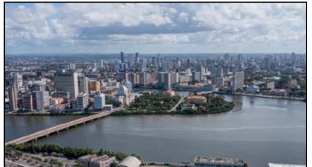
Recife acumulou saldo positivo de mais de 28 mil vínculos, sendo a 11ª cidade a gerar mais empregos no Brasil em números gerais

Comparando os empregos ativos atuais por número de habitantes, o Recife apresentou o melhor número dentre as capitais do Nordeste - com variação de 0,3013 - e foi o terceiro melhor saldo per capita, com 0,0173, ficando atrás apenas de São Luís (MA) e João Pessoa (PB), cidades que possuem quantitativos de cidadãos inferiores ao da capital pernambucana. CENÁRIO POSITIVO - O resultado positivo na geração de emprego em 2021 consolidou a partir de uma série de ações desenvolvidas pela Prefeitura do Recife, com o objetivo de preparar a cidade para a virada econômica no cenário de pós-pandemia.