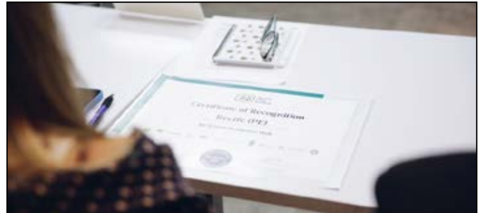
Capital pernambucana é uma das primeiras das Américas e Caribe a receber o título de Nó de Resiliência da MCR 2030, iniciativa liderada pelo Escritório das Nações Unidas para Redução de Riscos de Desastres