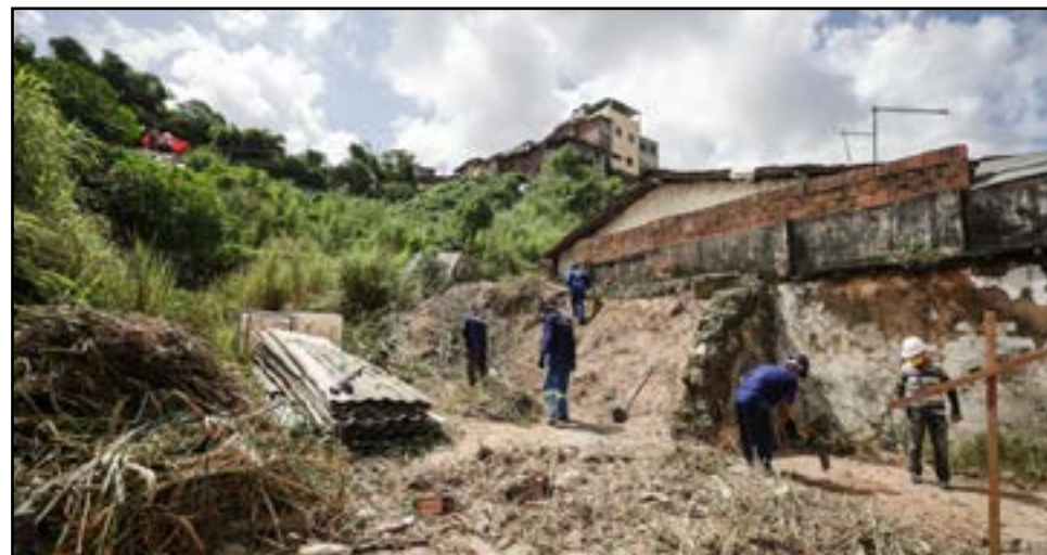
As obras totalizam um investimento de R$ 1,2 milhão

solo grampeado (reforço de solo obtido por meio da inserção de barras de aço e concreto), 185 m de drenagem, escadaria, 120 m 2 de pavimentação em paralelo, 80 m 2 de passeios e corrimão de proteção. A intervenção contará com o trabalho de até 20 trabalhadores e beneficiará de forma direta, aproximadamente, 30 famílias. A previsão é que as obras sejam concluídas em seis meses.