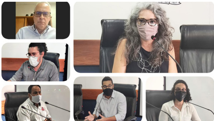
Reunião pública colocou aumento das passagens de ônibus em debate

A Câmara Municipal do Recife, durante esta semana, além dos debates e votações nas reuniões Ordinárias, sediou outros eventos que discutiram assuntos relevantes para os moradores da cidade. Diversas comissões permanentes da Casa analisaram dois projetos de lei do Executivo (PLE) para que sejam votados em plenário, um trata do AMA Carnaval e outro, da remuneração dos servidores. Uma reunião pública abordou o possível aumento da tarifa dos ônibus do Grande Recife.