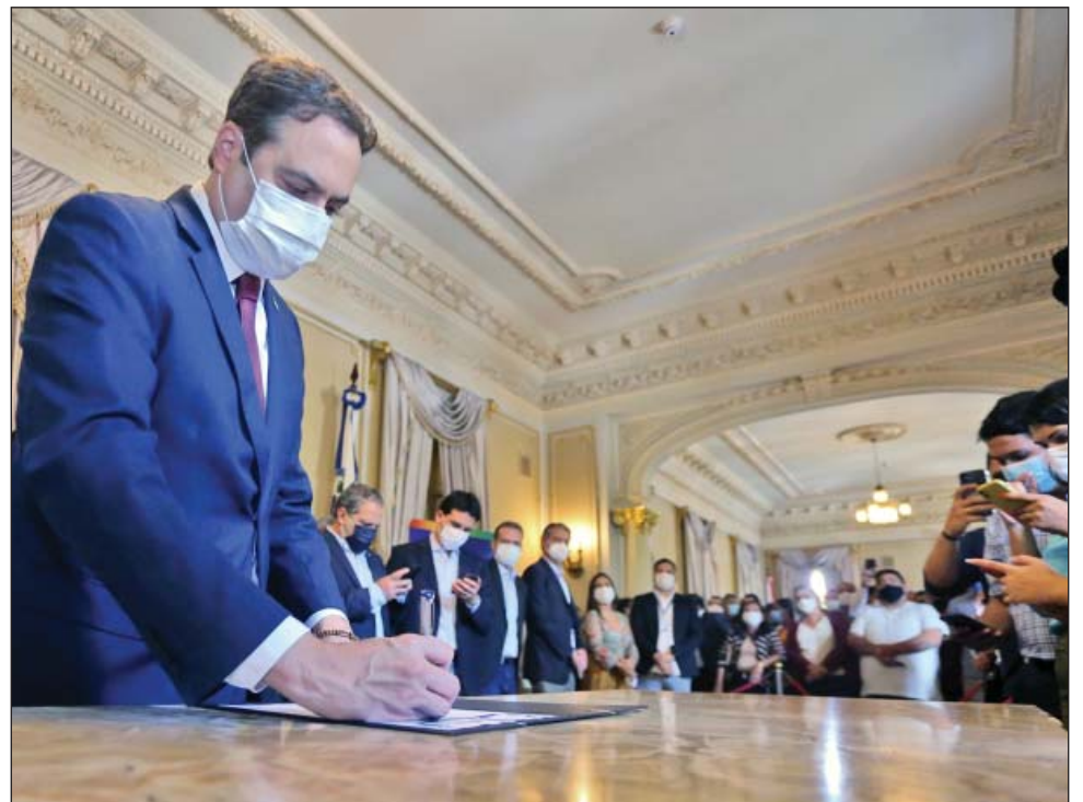
O GOVERNADOR assinou ordens de serviços, convênios e autorizações para abertura de licitações