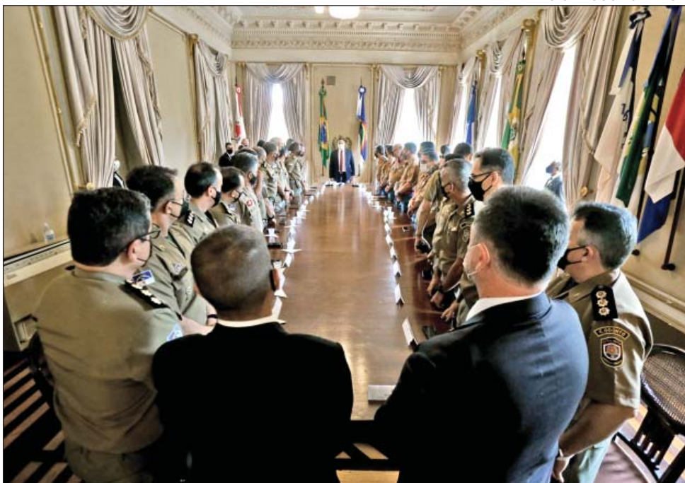
EM UMA iniciativa inédita, Governador recebeu recém-promovidos, como forma de reconhecimento pelos serviços prestados à população do Estado