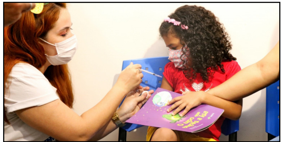
As vacinas contra o novo coronavírus foram devidamente testadas e aprovadas para o público infantil

dos cinco anos de idade. Para garantir ainda mais segurança, após receber o imunizante, os meninos e meninas ficam em observação no local por um período de 20 minutos. Os profissionais que farão aplicação das vacinas passaram por treinamento e estão devidamente capacitados para realizar este serviço. É importante destacar que a vacinação das crianças deve cumprir um intervalo de 15 dias (antes ou depois) entre as demais vacinas do calendário de imunização do público infantil.