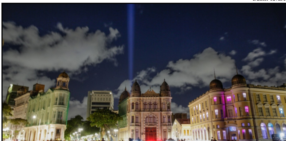
Ação iluminou o céu do Recife Antigo com uma projeção de luz branca

Diante dos atuais conflitos que chocam o mundo, a PCR resolveu manifestar apoio à paz entre nações