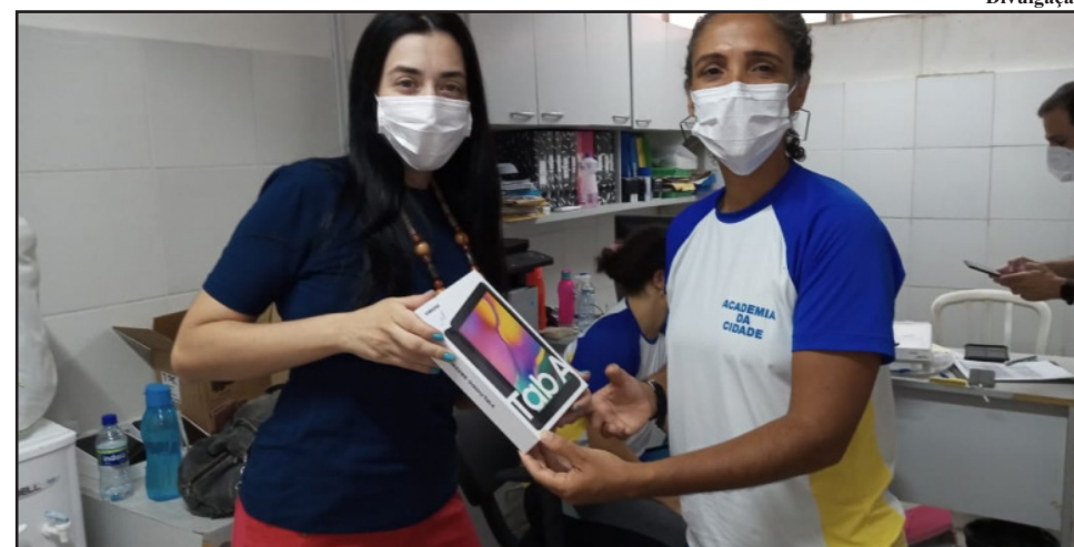
Os novos aparelhos vão otimizar o processo de trabalho de acompanhamento dos usuários cadastrados nos 41 polos do programa espalhados pela cidade

Na última segunda-feira (14), a Prefeitura do Recife iniciou a substituição dos 157 tablets dos profissionais do Programa Academia da Cidade