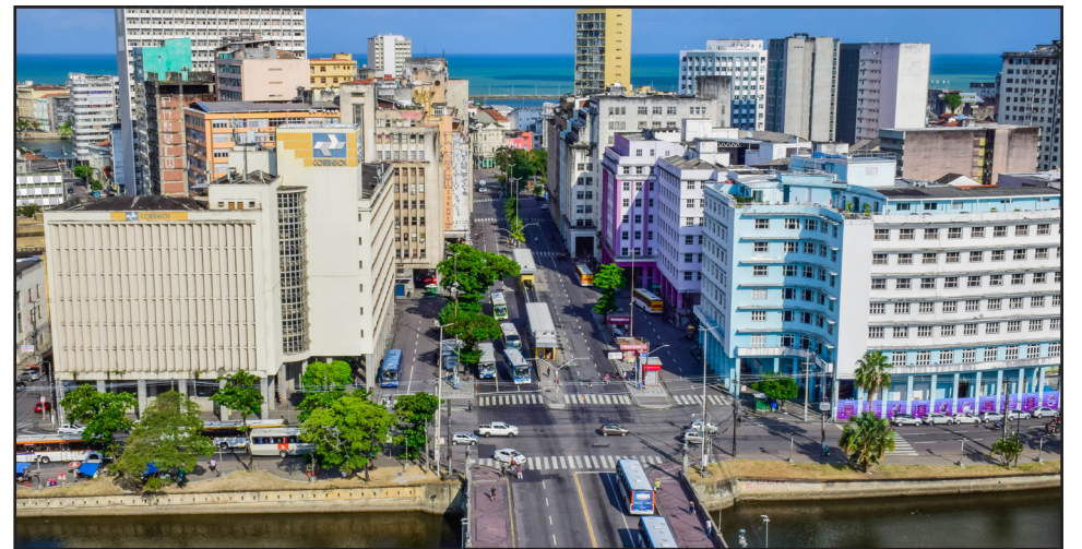
Capital pernambucana ficou na 18ª colocação geral entre os 101 municípios mais populosos do País e avançou 19 posições em relação ao levantamento de 2020

O Recife teve a melhor performance na determinante “Capital Humano”, ficando na 8ª posição geral no País, com 7,1813 de pontuação. Comparado com o resultado de 2020, a capital pernambucana avançou sete posições, quando ficou no 15º lugar. Assim como ocorreu há dois anos, Florianópolis liderou nesta determinante. Já no eixo