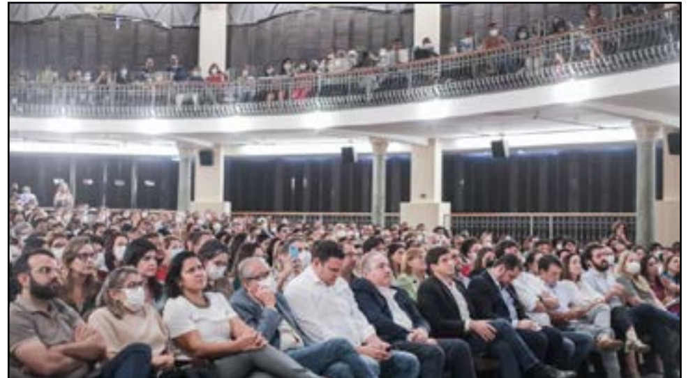
Rede ganhará novas unidades e o Atende em Casa será expandido para atender novas especialidades médicas. O anúncio do “Recife Cuida” foi realizado no Teatro do Parque, área central da cidade

atendimentos da Rede Municipal de Saúde, a Secretaria de Saúde (Sesau) do Recife já contratou 1.409 novos trabalhadores aprovados em concursos públicos, entre médicos, enfermeiros, profissionais de Educação Física, assistentes sociais, agentes de saúde ambiental e controle de endemias (asace), agentes comunitários de saúde (ACS), entre outros. Desse total, 1.280 novos profissionais foram chamados este ano. Outros 146 trabalhadores serão chamados a partir de hoje.