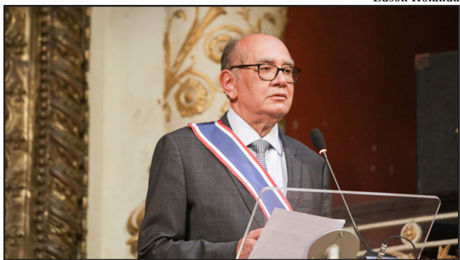
Medalha da Ordem do Mérito Capibaribe é a mais alta comenda concedida pela Prefeitura do Recife

O Teatro de Santa Isabel recebeu ontem (22), o ministro Gilmar Mendes, decano do Supremo Tribunal Federal (STF) com 20 anos de corte, para uma série de homenagens - incluindo a medalha da Ordem do Mérito Capibaribe, a mais importante comenda concedida pela Prefeitura do Recife. A cerimônia ainda contou com a entrega de outras honrarias, concedidas pelo Ministério Público de Pernambuco (MPPE), Tribunal de Contas do Estado de Pernambuco (TCE-PE), Tribunal de Justiça de Pernambuco (TJPE), Assembleia Legislativa de Pernambuco (Alepe) e pelo Governo do Estado. O ato contou ainda com uma apresentação da Orquestra Sinfônica do