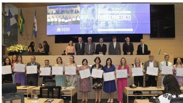
Reunião solene celebrou o Dia do Médico