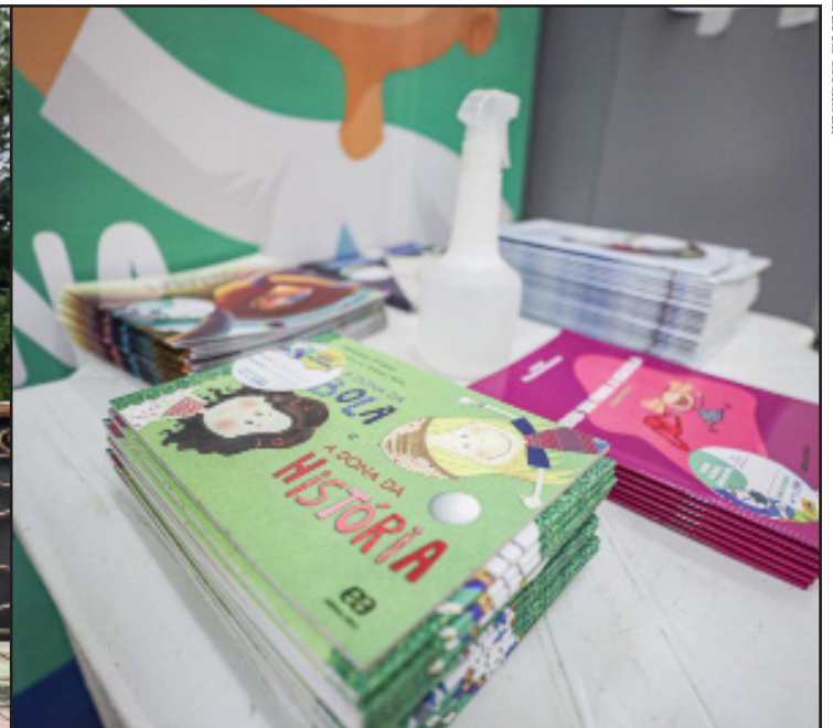
Esquema vacinal será feito em três doses. No dia da vacinação, os meninos e meninas ganham o certificado e livro