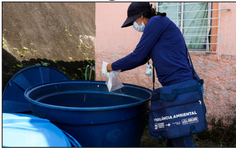
No fim de semana, 2,3 mil imóveis serão inspecionados por asaces

Hoje, os profissionais de Vigilância Ambiental do Recife visitarão 937 imóveis em Boa Viagem e 700 no Ibura. Já amanhã, os trabalhadores retornarão ao segundo bairro para inspecionar outros 700 locais. Durante as inspeções, será verificada a existência de criadouros do mosquito Aedes aegypti e a eliminação mecânica dos focos, bem como aplicação de larvicida biológico nos depósitos de água. No último Levantamento de Índice Rápido para Aedes aegypti (LIRaA), as áreas escolhidas para as ações apresentaram um maior índice de infestação do mosquito e risco de adoecimento da população, de acordo com indicadores entomológicos e epidemiológicos.