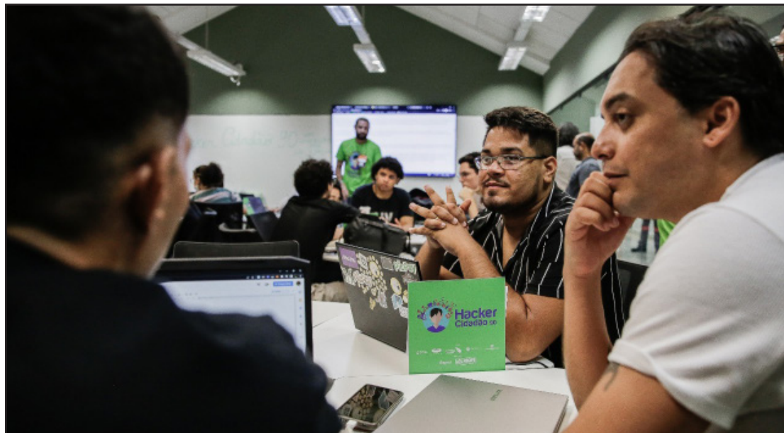
Ao todo, são 72 inscritos divididos em 11 grupos. Vencedores terão projetos incubados no E.I.T.A! Labs