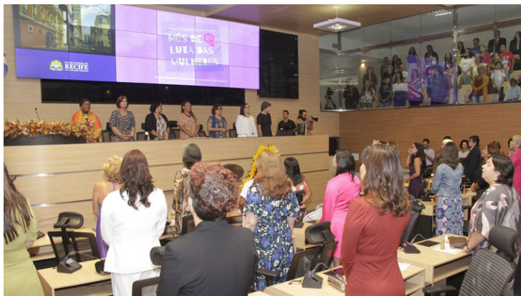
Solenidade na Câmara celebrou mês de luta das mulheres

A além das reuniões plenárias na segunda e terça-feira, a semana na Câmara Municipal do Recife foi palco para homenagens, debates e reuniões de comissões permanentes da Casa. Por conta de março ser considerado o mês das mulheres, duas reuniões solenes foram promovidas para dar destaque a causas femininas.