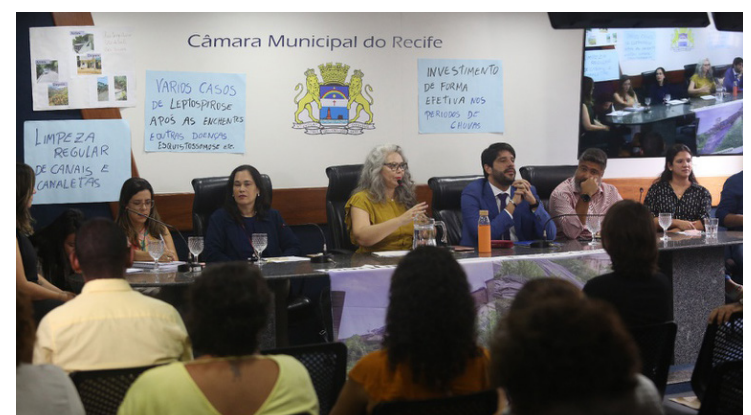
Audiência pública debate preparação do Recife para as chuvas

Comissões - Durante a semana, cinco comissões permanentes da Casa se reuniram para analisar pareceres a projetos de lei e outras proposições: Comissão de Acessibilidade e Mobilidade Urbana; Finanças e Orçamento; Educação, Cultura, Turismo e Esportes; Defesa dos Direitos da Mulher e Segurança Cidadã.