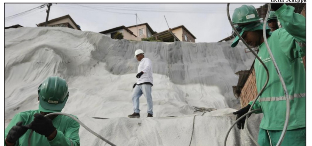
Ação faz parte das ações preventivas relativas ao inverno e tem o objetivo de evitar acidentes provocados pela chuva nos morros

O Programa Parceria conquistou, ano passado, o prêmio Pergaminho de Honra do Programa das Nações Unidas para